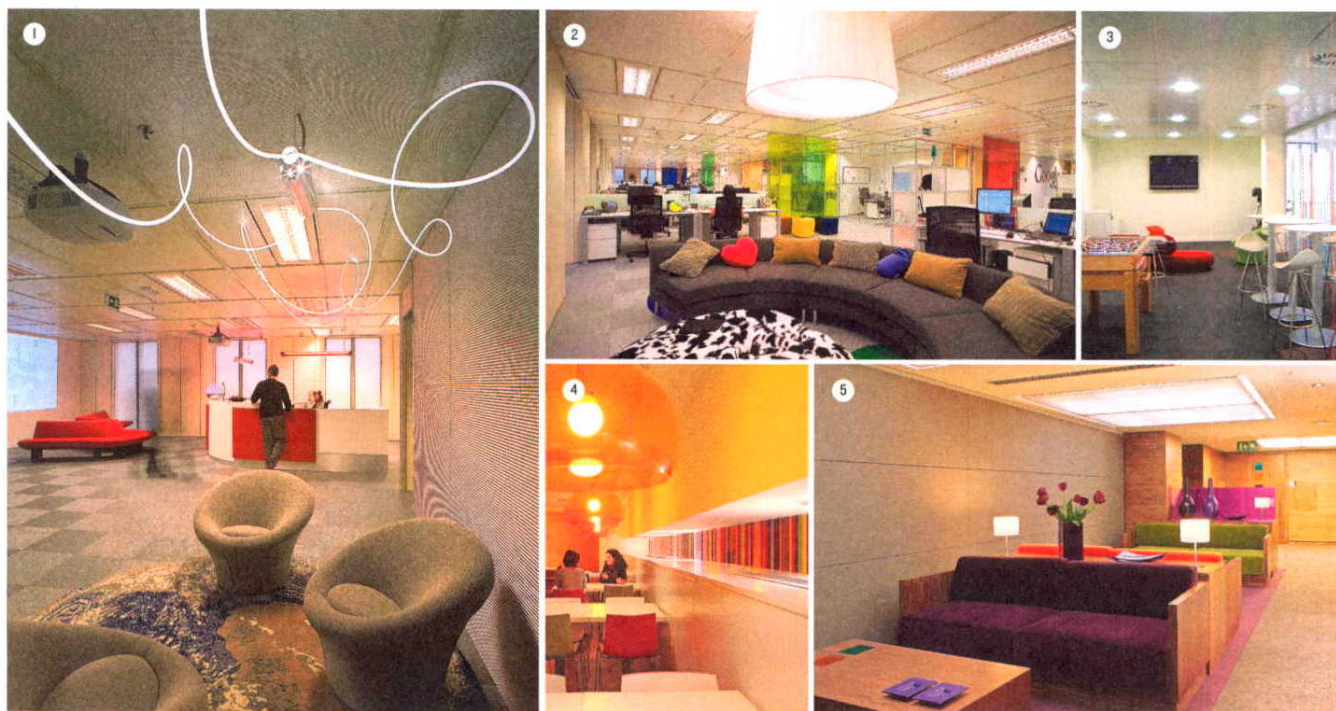
1. Recepción. Acceso a las oficinas de Google, en la Torre Picasso de Madrid, remodeladas por DEGW. 2. Área de trabajo. Zonas despejadas, paneles transparentes para no aislar visualmente a los trabajadores y un gran sillón para reunirse, también en Google. 3. Zona de recreo. Videojuegos y fútbol en Media Contacts. 4. Cafetería. Para tomar un refrigerio, en Price. 5. Sillones de reuniones. Para compartir confidencias, también en Price.